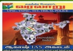
AKH 110- Rs:220