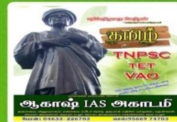
AKT 103- Rs:100