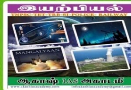
AKS 108- Rs:100