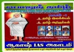
AKT 102- Rs:399