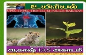
AKS 109- Rs:150