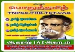
AKT 101- Rs:560