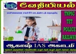
AKS 107- Rs:100