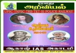
AKS 106- Rs:320