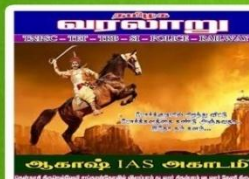
AKH 111- Rs:120