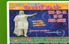
AKM 105- Rs:399