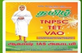
AKT 104- Rs:150