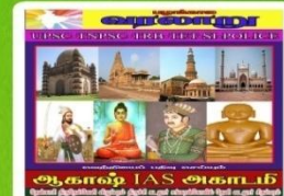
AKH 112- Rs:120